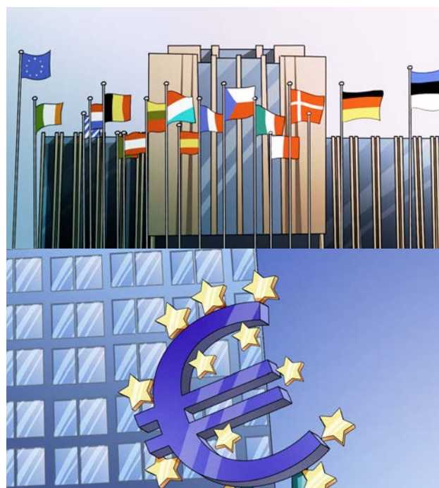
Figura 8: Fotos del Tribunal de cuentas de Luxemburgo y del Banco de Europa de Fráncfort del Meno.

Una vez acabado este proceso, el jugador tendrá opción de volver al estudio o salir del juego.