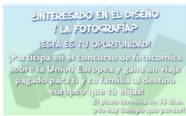
Figura 5: Propuesta de acción para el jugador de secundaria.

En el caso del producto para Secundaria, con la finalidad de reforzar el concepto de aprendizaje, nuestro protagonista debe establecer contacto con sus amigos europeos