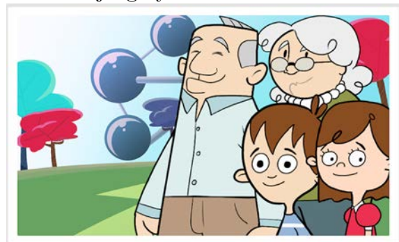
Figura 3: Fotografía de los principales protagonistas del juego.

finalizar el juego y a través de las cuales