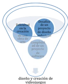
Figura 1: Diseño y Creación de un juego. Elaboración Propia.

proyecto de diseño industrial (entendemos el diseño industrial como una disciplina que permite conceptualizar una problemática y desarrollar un producto que dé respuesta a dicha necesidad, de modo que pueda ser replicada la solución de manera seriada) y la complejidad de un proyecto de software (concretamente de la gestión de un proyecto de software en el que un jefe de proyecto controla y coordina los recursos, costes, tiempos, planificación, entregables y calidad) (Figura 1). En resumen, diseñar y desarrollar un videojuego, con independencia de la sencillez o limitación de los contenidos que se vayan a presentar, es complejo, puesto que son muy variados los perfiles de los profesionales que deben trabajar en él.