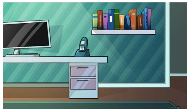
Figura 7: Interface del juego de secundaria.

le preguntará, al usuario, si quiere imprimir su fotocómic.