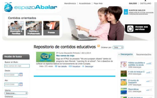
Figura 9: Captura de pantalla del espacio Abalar donde se puede ver uno de los videojuegos desarrollados.

Para finalizar, decir que ambos juegos han tenido muy buena acogida, ya que los usuarios a los que van dirigidos comentan que este tipo de acciones hacen más entretenido el proceso de aprendizaje. A la gran mayoría de los alumnos les divirtió el videojuego, creen que es fácil de usar y accesible y lo consideran útil para aprender cuestiones interesantes sobre la Unión Europea.