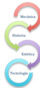
Figura 2: Elementos presentes en el diseño de un videojuego. Elaboración Propia.

Una vez que contamos con la idea a diseñar a implementar necesitamos 4 elementos más: